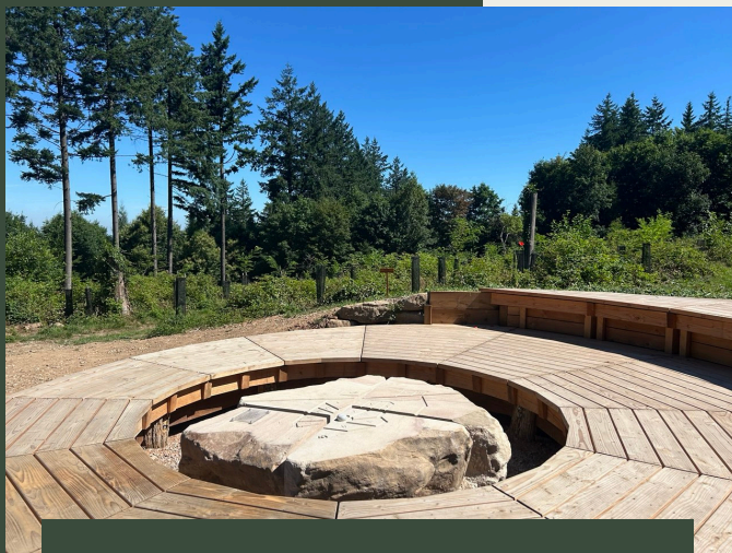
SYLVATUM ET PLATEFORME D'OBSERVATION