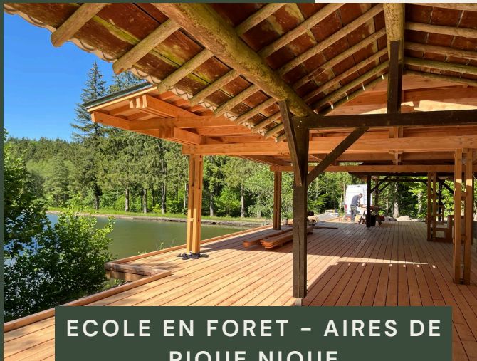
ECOLE EN FORET – AIRES DE PIQUE NIQUE