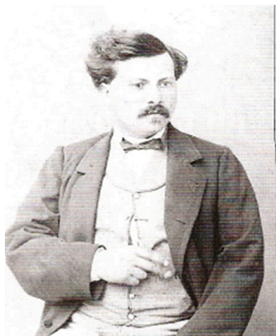
Victor CHAMPION FONDATEUR DE LA BRASSERIE

C'est en 1860 , que Victor Simon CHAMPION , jeune brasseur de Pressigny en Haute-Marne, arrive à la Brasserie de la Cense à Xertigny . Étudiant en Bavière à l'école de Weihenstephan , il est venu pour se perfectionner dans cette 1ère brasserie puis dans la Brasserie du centre ville de Xertigny .