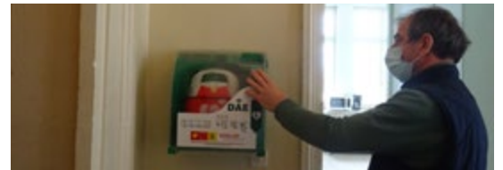
Plusieurs défibrillateurs ont été installés sur la commune : à la Mairie et à la Maison des Associations.