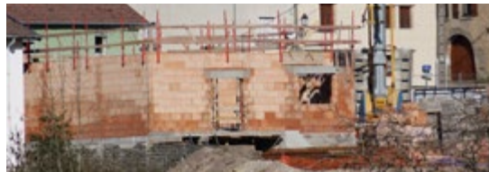
Les travaux d'Épinal Habitat se poursuivent pour la création des nouvelles cellules commerciales à l'ancien Stop Bar.

aménagement des abords de la Poste, aménagement des angles des rues Marius Becker, du Colonel Sérot et de la rue du Tillot. C'est d'ailleurs pour ces travaux que la Fontaine, située au Carrefour de la Poste, a été déplacée face à la Maison des Associations.