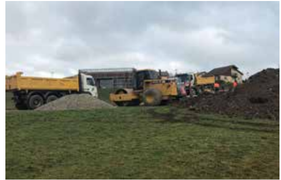
École des arbres et de la forêt (cf. article page 2) Les travaux ont débuté le mois dernier