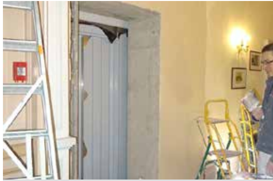
Hôtel de Ville L'ascenseur est posé !