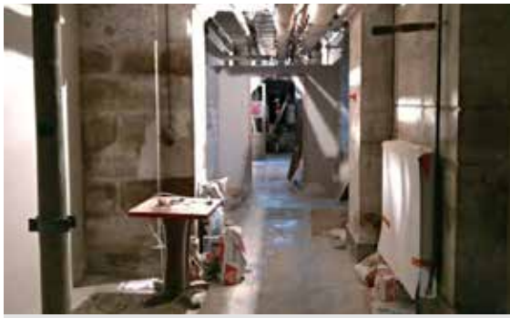
Couloirs du sous-sol du château