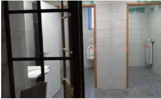
Installation de nouvelles toilettes