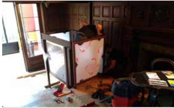
Pose d'un monte-charge pour fauteuils roulants