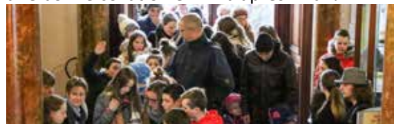
De nombreuses photos sont à découvrir sur la page Facebook de Xertigny !

ce sont 465 personnes qui sont venues relever les défis proposés par le CMJ afin de trouver le meurtrier, l'arme du crime et le lieu où il s'est produit ! L'animation fut un franc succès et a créé un engouement tel que certains visiteurs ont dû attendre à l'extérieur de la mairie afin de réguler le flux ! Après avoir fait chauffer leurs méninges, tous les participants ont pu partager une bonne collation en fin d'après-midi !