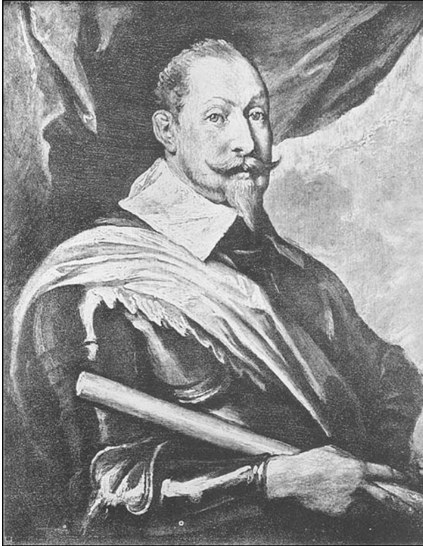
Gustave II Adolphe [Portrait par Anton van Dyck]

Face aux échecs de Tilly, l'empereur rappelle Wallenstein. Ses conditions sont exorbitantes mais il reçoit quand même le commandement d'une nouvelle armée impériale. Pendant que Wallenstein chasse les Saxons de Bohême, Tilly meurt de ses blessures après la bataille de Rain am Lech, le 15 avril 1632, contre les Suédois.