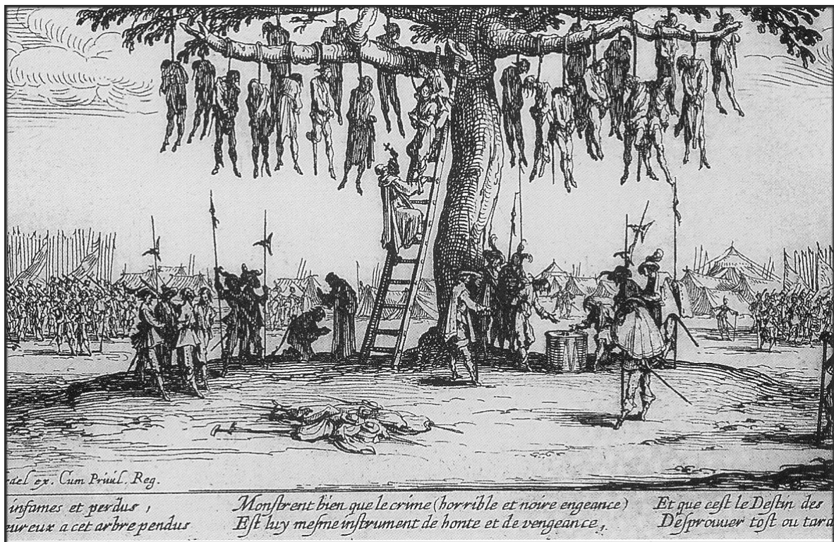
La pendaison [Gravure de Jacques Callot].

sont mangées par les rats et les souris, les bêtes sauvages rôdent aux abords des villages dépeuplés. Toute vie sociale paraît abolie et, instinct de survie oblige, certains cèdent même à l'anthropophagie.