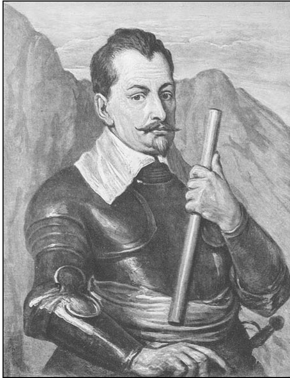
Albrecht von Waldstein ou de Wallenstein [Portrait par Anthony van Dyck, vers 1640]

L'empereur récompense richement Wallenstein qui devient un véritable maître de l'Allemagne du nord, un « presque souverain ». Cela provoque la jalousie des princes de la Ligue Catholique. La France, qui agit diplomatiquement contre l'empereur, obtient que Wallenstein soit relevé de son commandement lors de la diète de Ratisbonne en août 1630. C'est Tilly qui prend la tête des troupes impériales.