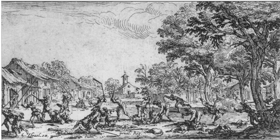
La revanche des paysans [Gravure de Jacques Callot].