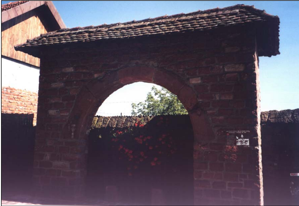
Porte des remparts d'Oberbronn, 1592 [Photo Philippe Houdry, 2001].

Il semble qu'Oberbronn, flanqué à la montagne et fortifié du côté de la plaine, n'ait pas trop souffert de ce premier épisode de la guerre de Trente Ans. Mais en décembre 1631, revenant d'opérations en Allemagne, 5.000 Lorrains de l'armée de Charles IV s'installent dans le nord de l'Alsace, certains plus particulièrement sur les terres des comtes de Hanau-Lichtenberg et de Leiningen-Westerburg. Cette occupation est mal supportée et la milice haguenauienne parvient à chasser les Lorrains de ses alentours. Mais cette révolte de la base, non soutenue par une armée amie, va se retourner contre elle. Des troupes suédoises, françaises, impériales et lorraines vont se succéder dans des raids dévastateurs. Des villages entiers sont pillés et incendiés. Un ancien village, appelé Kindwiller, situé entre Oberbronn et Niederbronn, semble avoir disparu à cette époque.