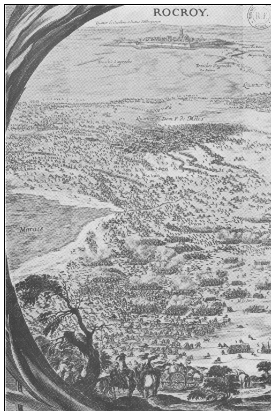
Bataille de Rocroi : En 1643, le futur prince de Condé écrase les Espagnols.