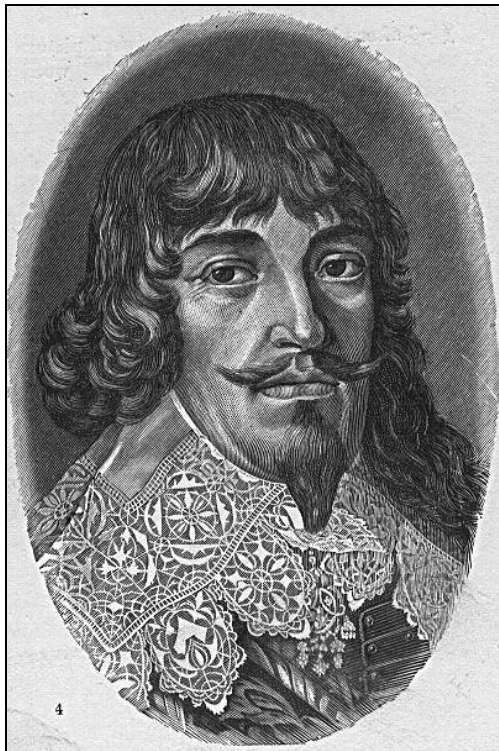
Bernard de Saxe-Weimar [du Wiki allemand].

Le 20 mai 1635, Châtillon et Brézé remportent une victoire sur les Espagnols, à Avein dans les Pays-Bas, mais les Espagnols sauvent leurs positions grâce à des renforts. Parallèlement, l'empereur négocie la « paix de Prague » avec plusieurs princes protestants. Les armées impériales commandées par Ottavio Piccolomini se portent contre les Pays-Bas et les troupes de Matthias Gallas, alliées aux Lorrains de Charles IV, vont sur le Rhin. Les Français sont ainsi contenus.