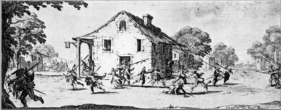
Soldats en maraude surpris par l'habitant, XVII ème siècle [Gravure de Jacques Callot].

Dès le début de la guerre en Alsace, parce qu'elle est alliée à la Confédération Suisse, Mulhouse est épargnée. Elle sert de refuge aux habitants des alentours. En 1629, la peste se déclare dans la ville qui est surpeuplée. En 1638, le nombre de réfugiés est bien supérieur à celui des Mulhousiens.