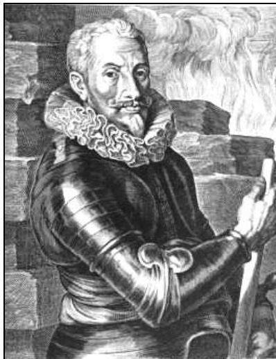
Johann Tserclaes (1559-1632), comte de Tilly [Portrait par van Dyck]

Le roi de France, Louis XIII, souhaite aider l'empereur malgré leur rivalité. Ils partagent le souhait de soutenir le catholicisme tant face aux Protestants que face aux Turcs. La médiation française réussit à Ulm en juillet 1620 et une trêve est proclamée entre Catholiques et Luthériens. Mais la Bohême est calviniste et, donc, exclue de ces accords. Les armées catholiques, conduites par Tilly et Bucquoy, écrasent les Bohémiens à la bataille de la Montagne Blanche (Bila Hora), près de Prague le 8 novembre 1620.