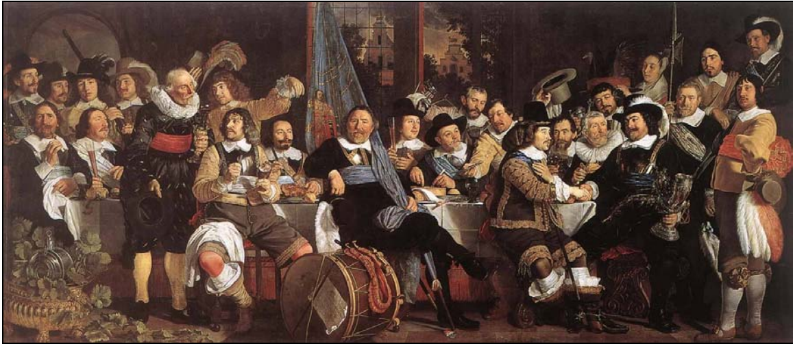
Les pourparlers de Münster [Bartholomeus van der Helst, peinture 1648].