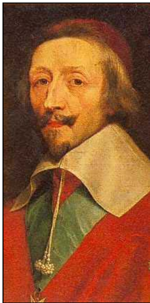
Armand Jean du Plessis, duc de Richelieu [par Philippe de Champaigne]

Malgré les souhaits de la France, le parti des Habsbourg l'emporte sur ses adversaires protestants. Pour maintenir l'équilibre, la France doit à son tour s'engager dans le conflit armé. Une intense activité diplomatique précède l'entrée en guerre, avec de nombreux traités avec les ennemis de l'empereur et de l'Espagne. Il est, entre autres choses, convenu avec les Hollandais le partage des Pays-Bas espagnols (en gros, l'actuelle Belgique).