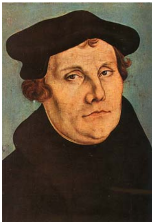
Martin Luther [par Lucas Cranach der Ältere, peint en 1529]

À la suite de la prédication de Martin Luther, de nombreux états allemands adoptent le protestantisme. L'empire est alors divisé en deux camps qui vont s'opposer militairement suite au mouvement de Contre Réforme dirigé par la Maison de Habsbourg pour restaurer le pouvoir du camp catholique.