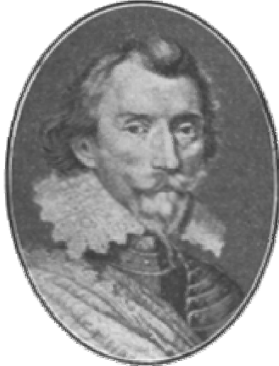
Ernst von Mansfeld (1580-1626)

De nombreux princes protestants estiment que l'empereur a outrepassé ses droits. C'est là une cause majeure de la poursuite et de l'extension du conflit. Trois princes, à la tête de troupes de mercenaires restent en armes : le comte Ernst von Mansfeld, le plus redoutable, qui retourne vers les rives du Rhin avec 20.000 hommes, et deux autres, Christian de Brunswick et Georg Friedrich de Bade-Durlach qui ont chacun 15.000 hommes.