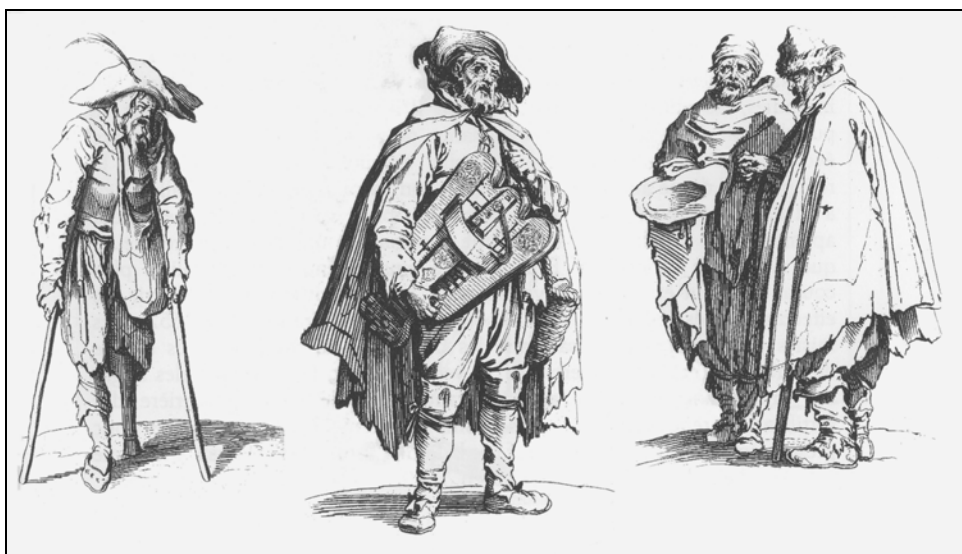
Les gueux [Gravure de Jacques Callot].

Entre 1649 et 1655, alors que les tentatives de reconstruction sont déjà amorcées, des troupes françaises et lorraines sévissent encore en Alsace, notamment au Ban de la Roche dans la vallée de la Bruche.