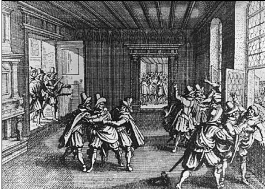
Défénestration de Prague

L'empereur Matthias Ier, qui est aussi le roi de Bohême, est sans descendance. Il nomme alors Ferdinand de Habsbourg comme roi de Bohême, à sa place, en 1617. Ferdinand II veut voir revenir la Bohême au sein de l'Église catholique alors qu'elle a reçu, par lettre de majesté en 1609, des garanties concernant sa liberté religieuse. Suite à des incidents survenus entre l'archevêque de Prague et les Luthériens, Ferdinand II leur envoie deux émissaires : Martinitz et Slawata. Ceux-ci sont passés par la fenêtre sans être sérieusement blessés car ils tombent sur un tas d'ordures.