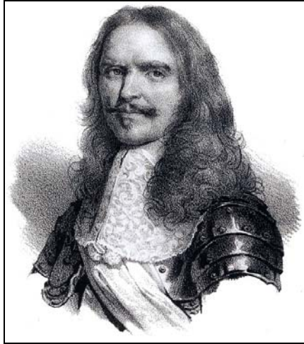
Henri de la Tour d'Auvergne-Bouillon, vicomte de Turenne.