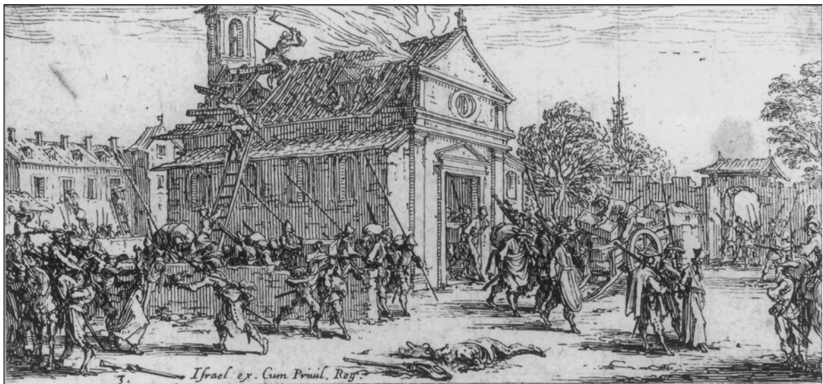
Dévastation d'un monastère [Gravure de Jacques Callot].

Pendant les premiers mois de 1632, les garnisons impériales et celles de leurs alliés, les Lorrains, s'installent en Alsace. Elles s'attaquent aux territoires dépendant de Strasbourg, ville protestante, déjà prête à collaborer avec les Suédois. Des mercenaires strasbourgeois chassent des Lorrains qui s'attaquaient à Barr.