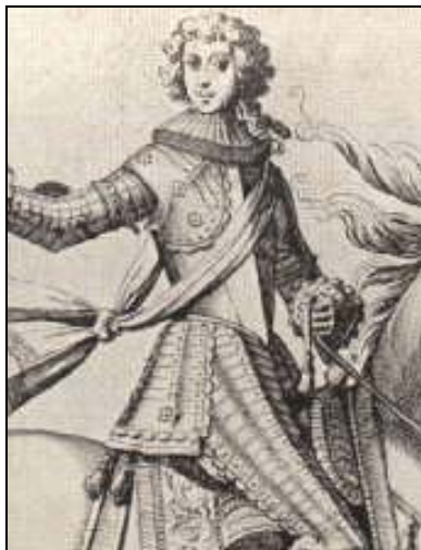
Le duc Charles IV de Lorraine-Vaudémont.

Quelques places fortes vont résister encore quelques temps : Bitche, la porte nord-est du duché vers l'Alsace, et la Mothe en tant que porte sud. Mi-mars 1634, commence le siège de la Mothe qui s'accompagne de la destruction des villages alentours de Soulaucourt et d'Outremecourt. Après la mort d'Antoine de Choiseul d'Ische, gouverneur du lieu, la capitulation est signée le 26 juillet. La forteresse de Bitche tombe face aux Français le 18 mai 1634.