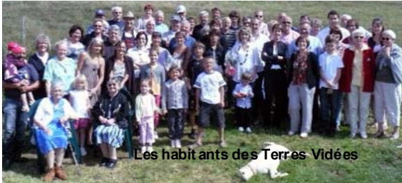
Les habitants des Terres Vidées

Pour animer la fin de la période estivale et garder le moral envers et contre tout, les xertinois organisent encore quelques dernières festivités avant la rentrée. Samedi 13 août a eu lieu, pour la deuxième année, le repas de quartier de la rue du Manège. Au vu de la participation quasi-totale de