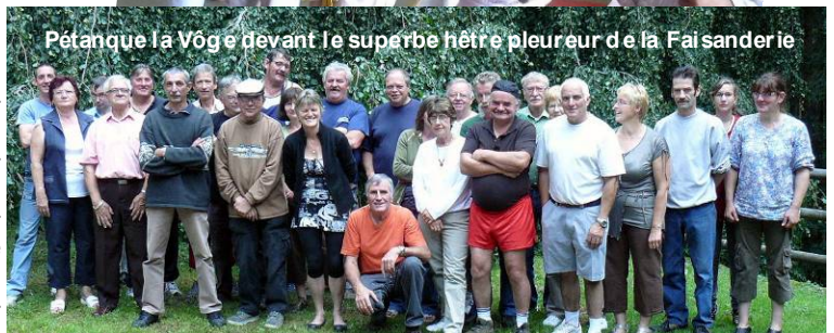
Pétanque la Vège devant le superbe hêtre pleureur de la Faisanderie