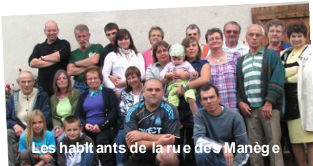
Les habitants de la rue des Manèges

Le repas fut vraiment apprécié par les participants, ravis de trouver ce lien de l'habitat pour ré-