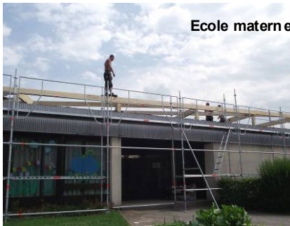
Ecole maternelle du centre