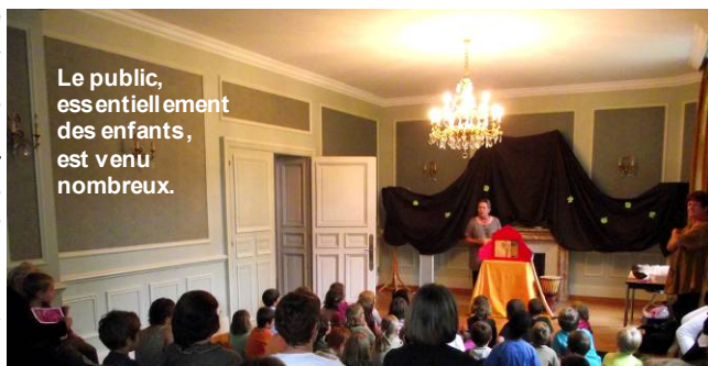
Le public, essentiellement des enfants, est venu nombreux.