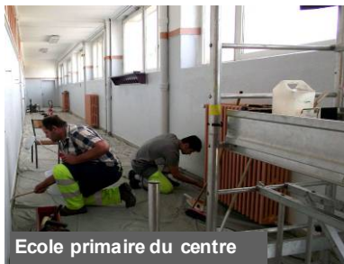
Ecole primaire du centre

que l'école soit opérationnelle à la rentrée scolaire de septembre, si aucun impondérable ne vient retarder le calendrier ! Le coût de ces travaux, avec la maîtrise d'œuvre réalisée par le même cabinet est de 130 281,33 € HT. De leur côté, les agents techniques communaux redonnent un coup de jeunesse à la cage d'escalier et au couloir de l'aile droite de l'école primaire du centre, et apportent les modifications nécessaires aux autres sites.