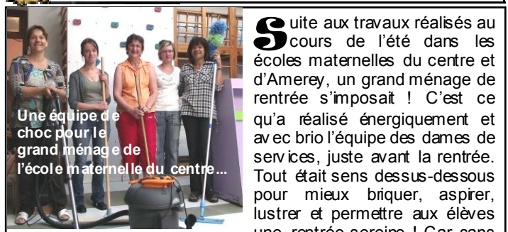
Une équipe de choc pour le grand ménage de l'école maternelle du centre...