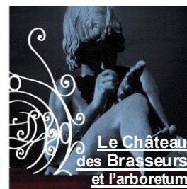
Le Château des Brasseurs et l'arboletum

> Visites guidées du Château samedi 17 et dimanche 18 à 10h30, 14h, et 16h.