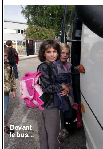
Devant le bus...