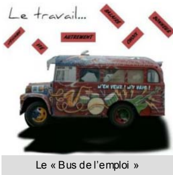
Le « Bus de l'emploi »

la fois personnalisée selon les projets du demandeur, et leur degré d'avancement, mais également globale car elle prend en compte tous les aspects de la situation du jeune, ainsi que des contraintes pragmatiques (transport, permis, aptitude physique, logement...). Vous pouvez contacter la Mission Locale au 15 rue de Nancy 88 000 Epinal, Tél. : 03 29 82 23 05, Fax : 03 29 35 75 19, Mail : accueil@ml-epinal.fr Elle est également relayée localement par les différents RSP (Relais Service Public), une antenne se situe à Xertigny, 2b, rue du Commandant St-Semin, 03 29 29 04 90. Vous pouvez prendre rendez-vous avec M. DIDIERLAURENT, conseiller du PAIO qui y assure une permanence chaque semaine. Poussez la porte !