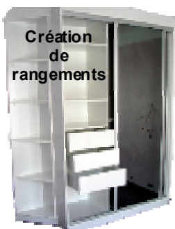
Création de rangements

Mais en plus de tout cela, il peut également créer un meuble personnalisé et unique, ce qui répond non plus à un besoin, mais à une envie ! Vous pouvez le contacter au : 03 29 36 03 23 ou 06 40 43 43 58 ainsi que par mail : thiebaut.yvette@sfr.fr.