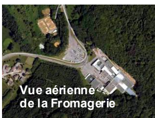
Vue aérienne de la Fromagerie